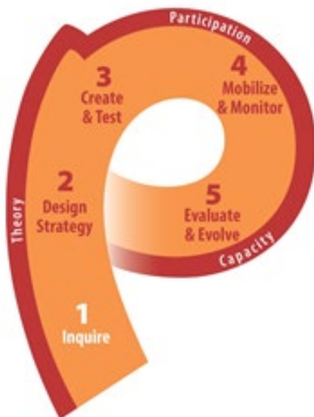
Figure 1: P-Process™